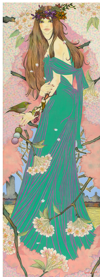
DNAT 作家 大槻透 「お花見の女神」

期間中に現地に行くことができないアートファンに対し、オンラインギャラリー@Gallery TAGBOAT のウェブサイト上で、イベント中やイベント終了後も引き続き出品作家の作品をオンラインで購入することができます。(※一部作品をのぞく)