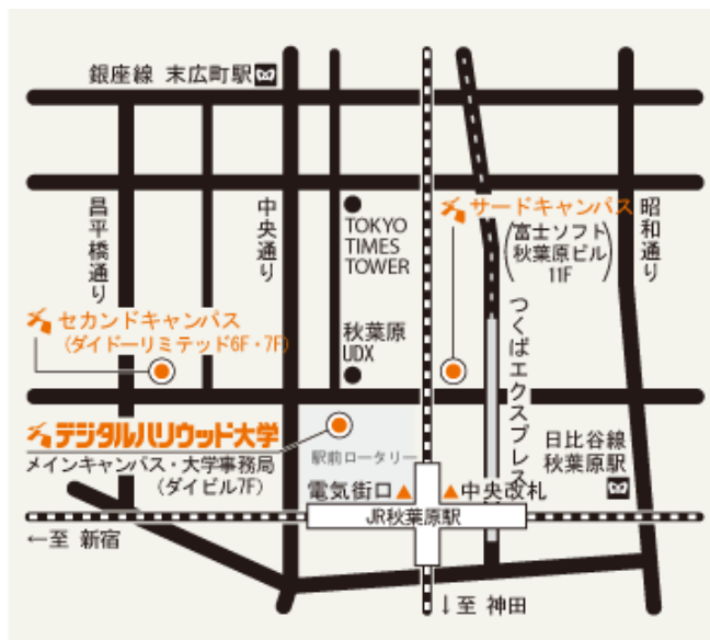
<デジタルハリウッド大学 秋葉原メインキャンパス> 東京都千代田区外神田 1-18-13 秋葉原ダイビル 7階