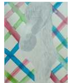
「生まれる前の赤ちゃん犬」

ゆとり教育の見直しなどで、図工の時間などアートに携わる授業が減っている中、キッズベースキャンプでは子どもたちの特性や才能を伸ばすべく、アートに触れる時間を増やし、さらに学校の美術では学べないようなアートの世界を知り、体験する機会を提供したいと考えています。