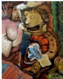
奥まゆみ 「塵ヌルヲ no.23」