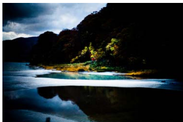
川久保ジョイ 「林里如涅槃 - Pillars of Hell -」